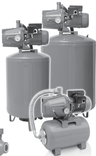
Sistemas Hidroneumáticos: Aumentan la presión del agua

Se recomienda la instalación de un par de electroniveles Rotoplas (ver guía de instalación del electronivel).