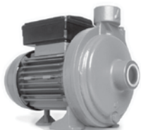
Bomba de Circulación: Para calentadores Instantáneos