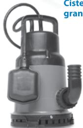
Sumergibles: Saca el agua de donde quieras