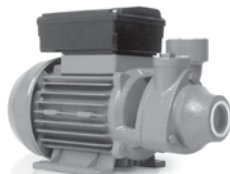
Periféricas: Para Cisterna - Tinaco a gran altura