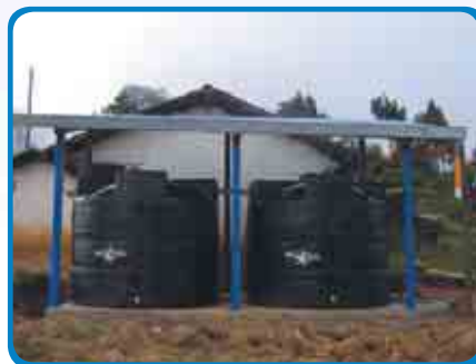
Fabricación de tejabanos para la captación de agua pluvial