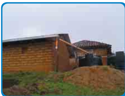
Aprovechamiento de techumbres en las viviendas