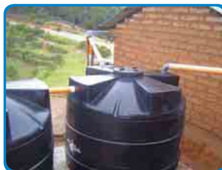
Sistemas modulares de captación